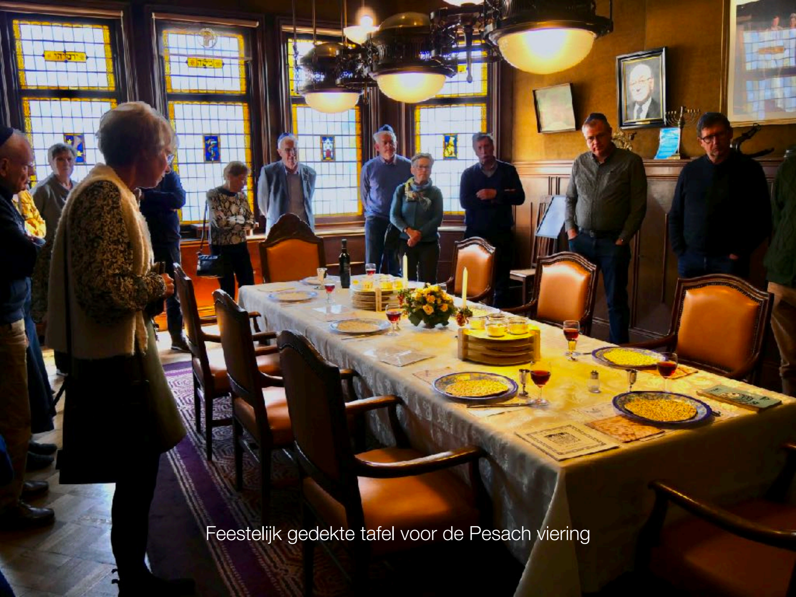
Feestelijk gedekte tafel voor de Pesach viering