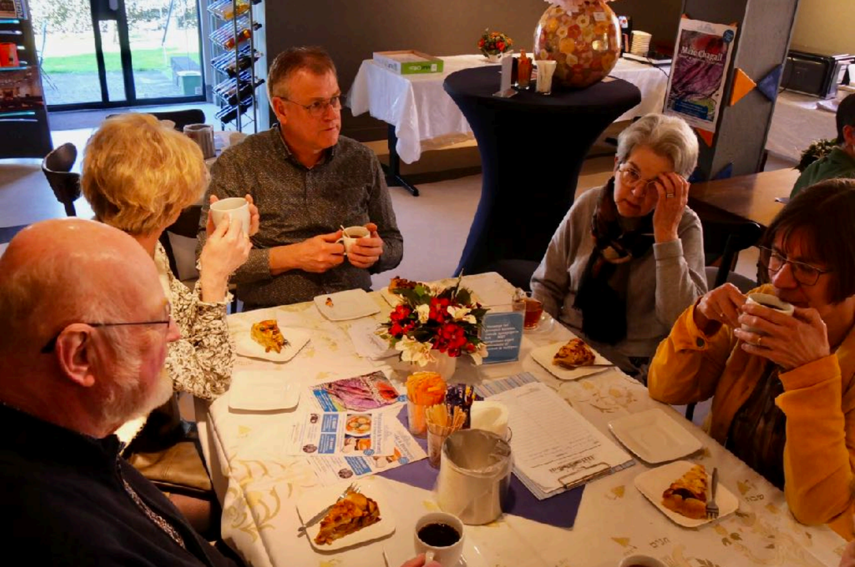
We vertrekken om 9.00 vanaf de Bevrijdingskerk en worden om 10:30 uur verwelkomd met koffie met appeltaart