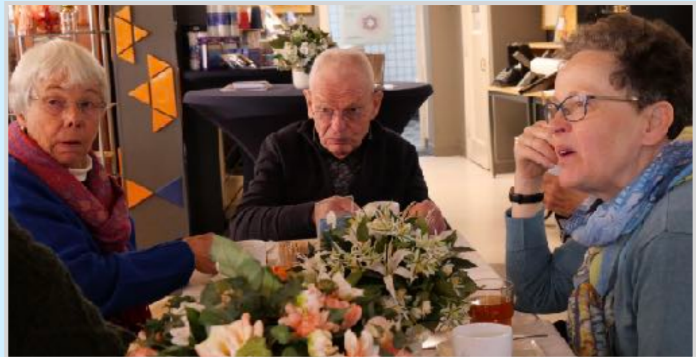
Voordat we de rondleiding door de synagoge maken krijgen de mannen een keppeltje uitgedeeld