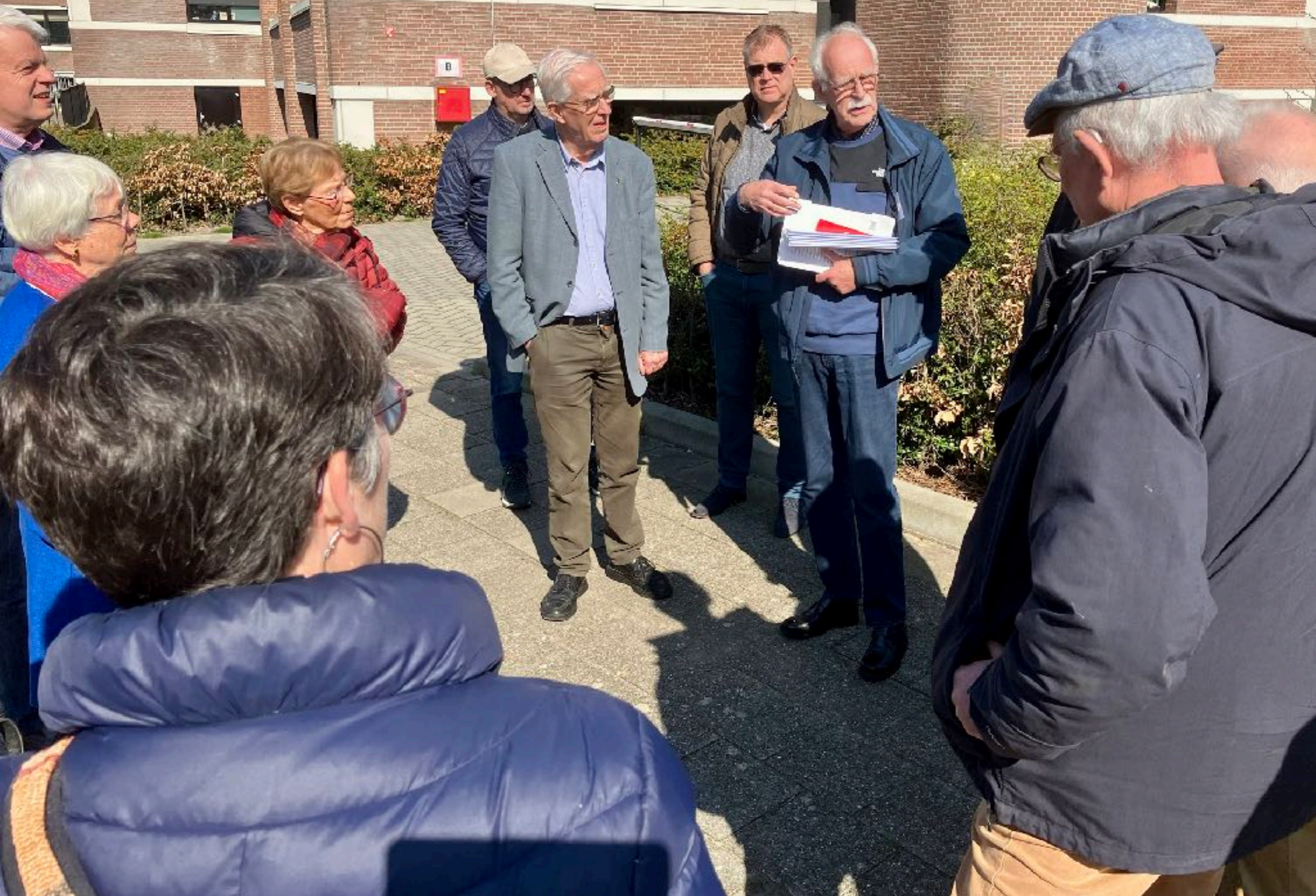
Na de lunch van champignonsoep en preitaart is het tijd voor een stadswandeling of film